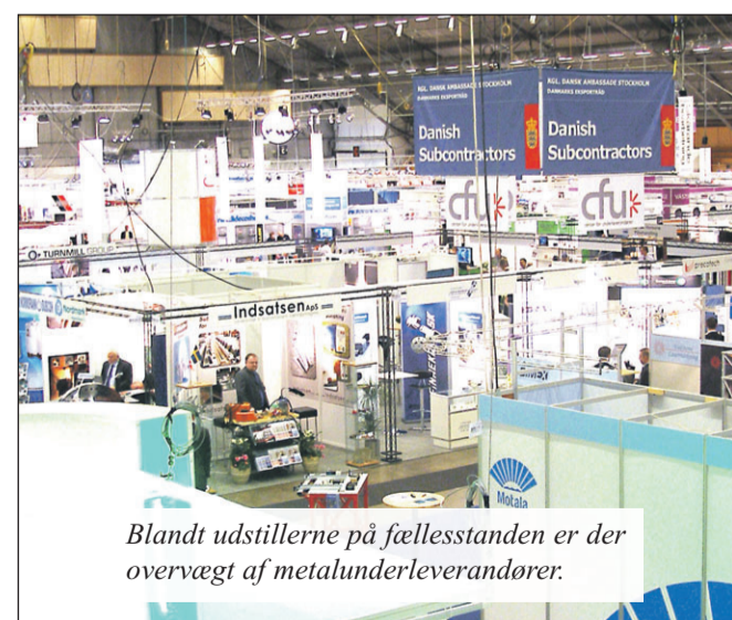
Blandt udstillerne på fællesstanden er der overvægt af metalunderleverandører.

CFU har i øvrigt sammen med Væksthus-Midt taget