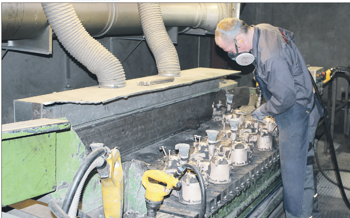
De mangeartede aktiviteter hos støberiet omfatter blandt andet Crestos faldsikringsløsninger, Res-Q DD, og Nadiros Drop-In-Ball-udløsermekanisme til redningsbåde.

Svendborg-virksomheden Nadiro A/S er en anden maritim aktør med tilknytning til UG Metal. Her har støberiet medvirket til udviklin-